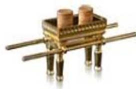
הַשֻּׁלְחָן לֶחֶם פָּנִים